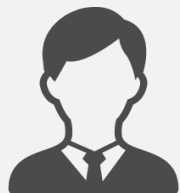
某鉄道系 広告代理店様

また、ご発注フローもメールのみで対応してもらえるため、他の運用会社よりも事務的な工数が少なく対応してもらえます。