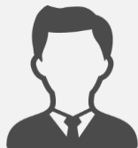
某大手新聞社系 広告代理店様